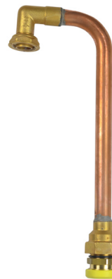
CALIBRE ÉQUIPÉ DU SYSTÈME CLAP